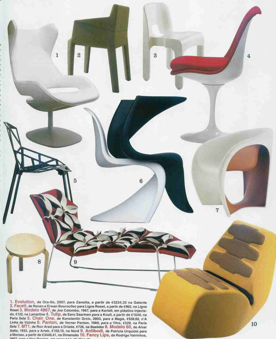
1. Evolution , de Ora-Ito, 2007, para Zanotta, a partir de €3234,33 na Galante 2. Facett , de Ronan e Erwan Bouroullec para Ligne Roset, a partir de €962, na Ligne Roset 3. Modelo 4867 , de Joe Colombo, 1967, para a Kartell, em plástico injectado, €122, na Lamartine 4. Tulip , de Eero Saarinen para a Knoll, a partir de €1040, na Paris Sete 5. Chair One , de Konstantin Grcic, 2003, para a Magis, €938,60, n'A Linha da Vizinha 6. Panton , de Verner Panton, 1960, para a Vitra, €229, na Paris Sete 7. MT1 , de Ron Arad para a Triade, €726, na Bastidor 8. Modelo 60 , de Alvar Aalto, 1933, para a Artek, €156,10, na Nord 9. Antibodi , de Patricia Urquiola para a Moroso, a partir de €3449,41, na Dimensão 10. Fancy Lips , de Rodrigo Vairinhos, 2007, para a Neo Design, em www.neo-studios.de